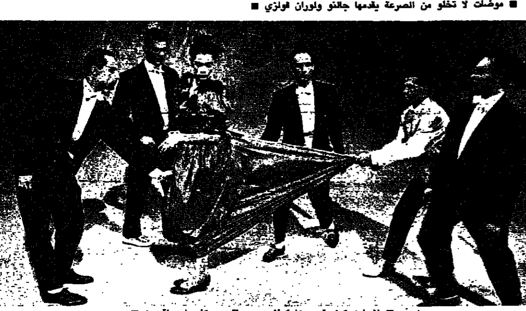
لنوهه كما يتصورها كينزو مع بيتراس كامورا وراقصين

الموضة، كما لم تخطر في بال احد، انها موضوع فيلم سينمائي، يشترك فيه عدد من «موهوبات»، وهن: موهوبي، والشانقة الكبيرة، امثال كستابلجك وغولتبييه واليا وكينزو وتوماس ومولغر. والفيلم الذي استعرضه قصر، ولا يطمح لانتاج اشكال الشاشات... هذا ما يؤكد، المخرج، وليام كلين، الذي صور تلك المصنوعات بدون تركيز، والهدف تسلط اضاءة جديدة على الموضة كطريقة استعمال. والفيلم الذي يشترك في انتاجه، كون، سوف تبثه القناة الاولى في التلفزيون الفرنسي. وليام كلين يعمل بلا انقطاع بهدف احراز العمل الذي تموله مؤسسة الازياء، ويستهدف التثدي على الجمالية المعاصرة في الزي واللون، وتلاحظ ان كلين، ينوع من الصن الميثولوجي، اراد خلق الموضة او تدميرها، غير سلسلة من الاستكشافات او المواقف المنفسية في اليوميات الواقعية او التصويرات الخشبية. الفيلم يتوزع على ١٢ مشهرا، وشدة استعراض الازياء قديمة وحديثة، ودخول اتي دوائر المصممين الكبار، ومواكبة للناس في الشوارع.